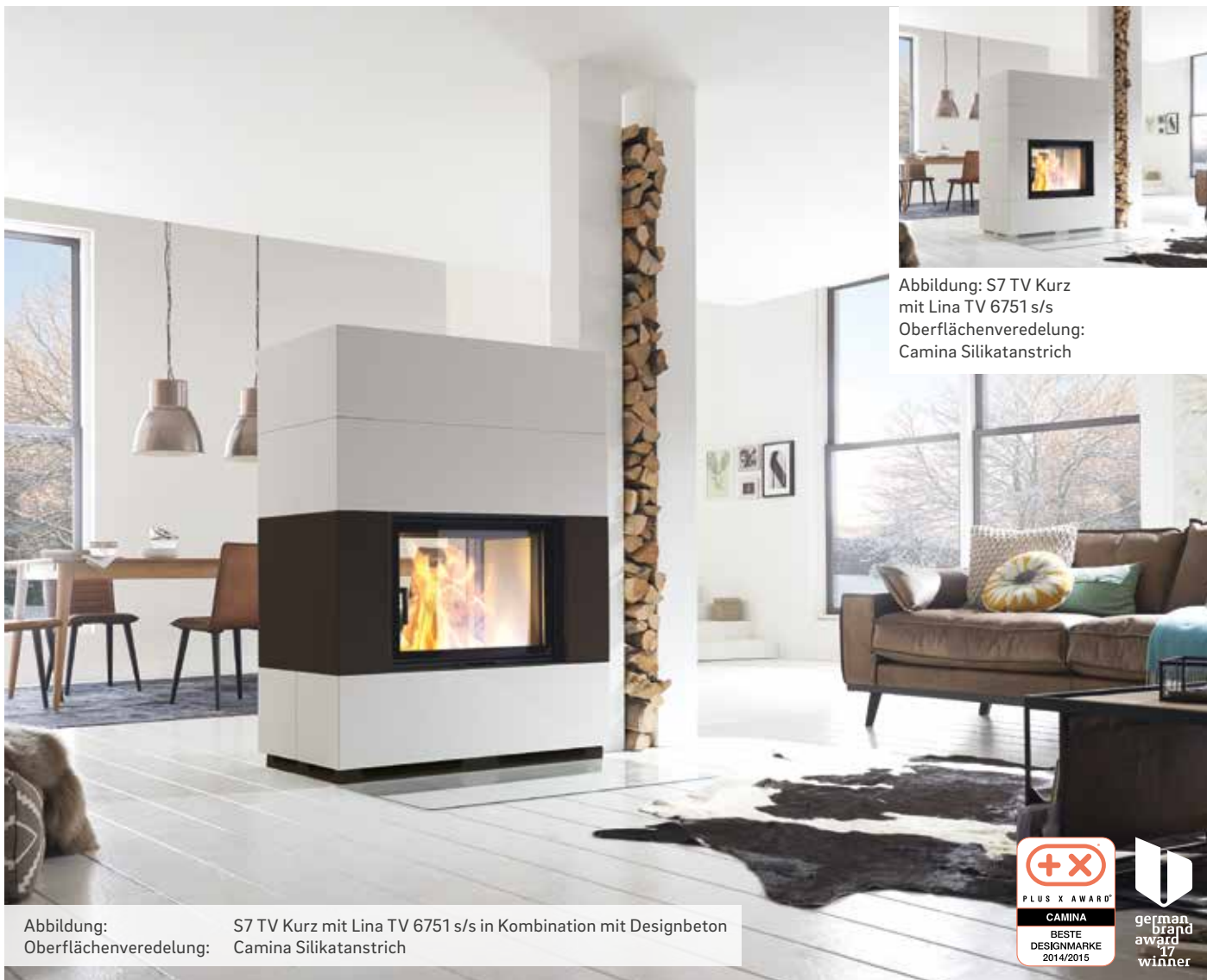
Abbildung: S7 TV Kurz mit Lina TV 6751 s/s Oberflächenveredelung: Camina Silikatanstrich